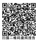
扫描二维码查阅报告